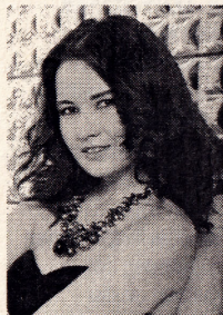
RAFAEL CAVERO Tenor