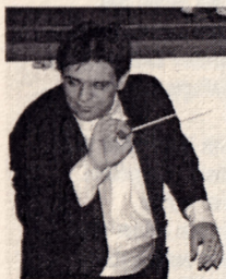
SIEMENS- ORCHESTER MÜNCHEN e.V.